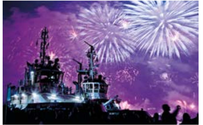
Gürsel EGEMEN ERGİN